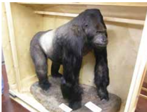
Samson udstillingens abe, som havde eget værelse i en kasse.