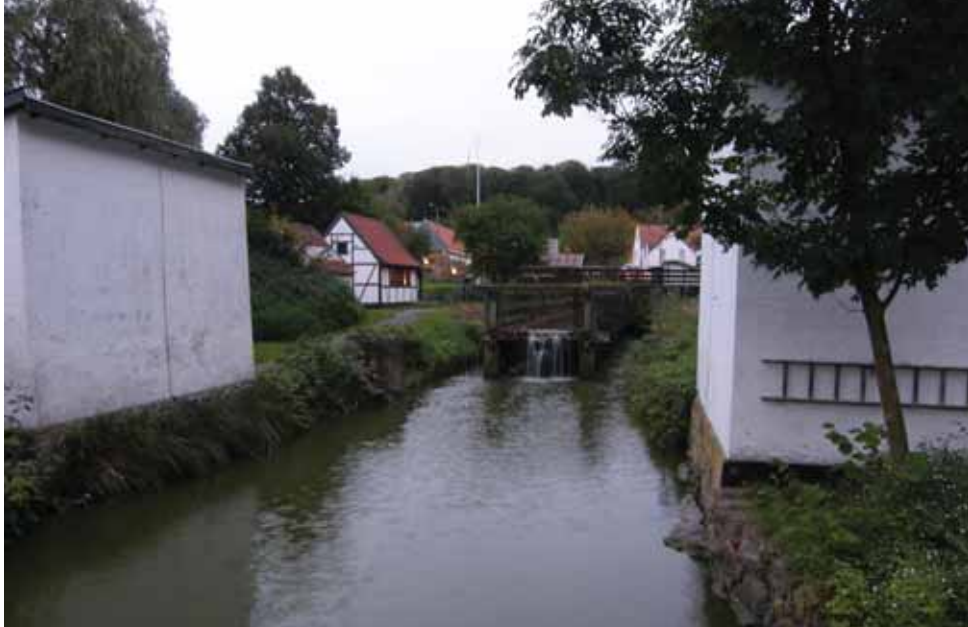
Kanal udsigt ved Krudtværket i Frederiksværk.