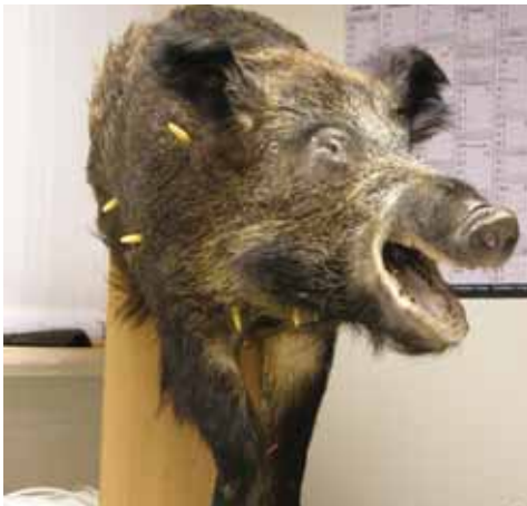
Vildsvin som et under konservatorens kærlige hånd.