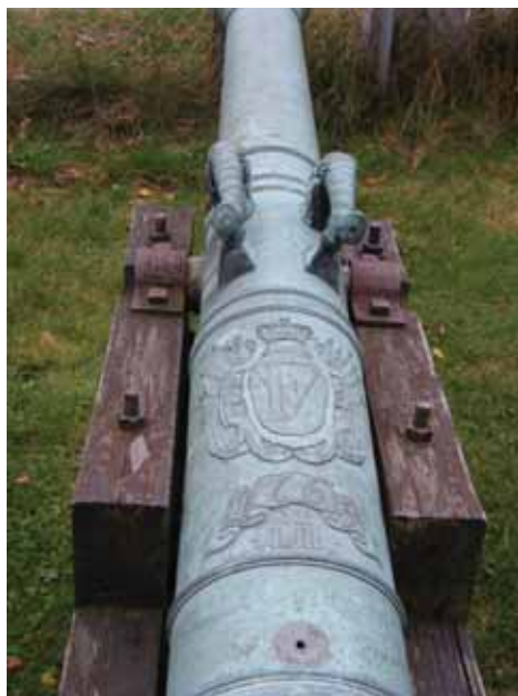
Udsmykning på kanon støbt i Frederiksværk, kan ses på mange kanoner landet over.