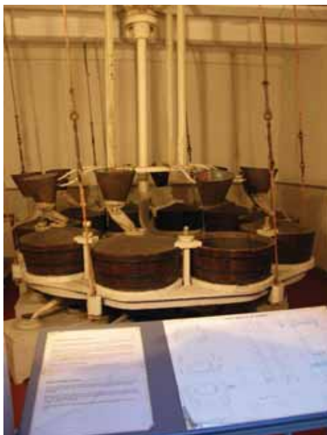
Sorterings maskine for krudttørrelser.

Den lille kanal er en del af en større plan, som Frederik IV i 1717 satte i gang. Danske soldater og svenske krigsfanger blev beordret til at grave en kanal fra Arresø ud til Roskilde Fjord.